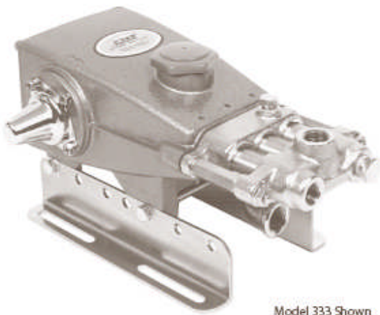
Model 333 Shown