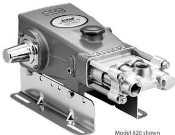
Model 820 shown